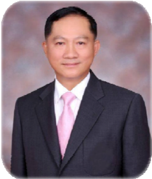
พลตำรวจเอก อุดลย์ แสงสิงแก้ว