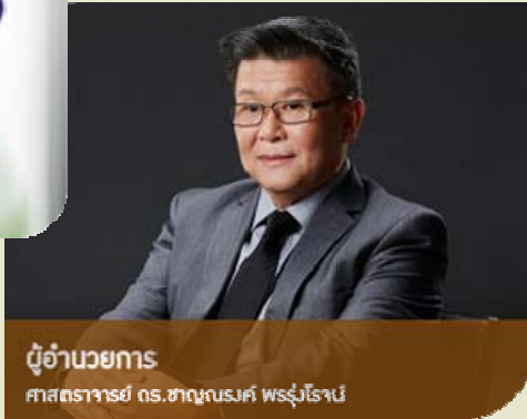
ผู้อำนวยการ